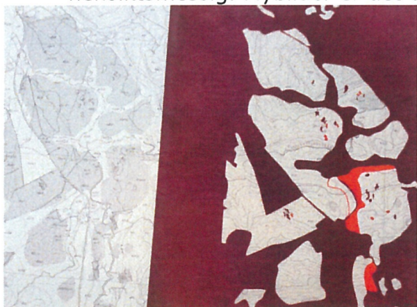
Figur 2 Utsnitt av myrfolie ved siden av tilsvarende område på ferdig ØK-kart.

Grunnlagsmaterialet er konstruert slik at det fysisk må legges over det tilsvarende ØK-kartet for å kunne tolkes. Digitalisering er mulig, men lite hensiktsmessig. Flybilder er det opprinnelige kildematerialet som myrfolien baserer seg på. Flybildenegativene, som i dag ligger på Hønefoss og skal bevares, blir så langt det er gjennomførbart, digitalisert der de også blir etablert som ortofoto . Dette muliggjør konstruksjon av nye kart basert på gamle flybilder i tillegg til gjenfinning av gamle myrer. Den enkleste måten å gjenfinne myrinformasjon på er likevel å bruke ØK-samkopien/ØK-kartet med avtegnet myr vist i figur 2. Argumentet for å bevare myrfolien i sak 2019/15446 kan vi dermed se bort fra. Samtlige myrfolier kan kasseres fordi informasjonen som finnes på disse er å finne andre steder.